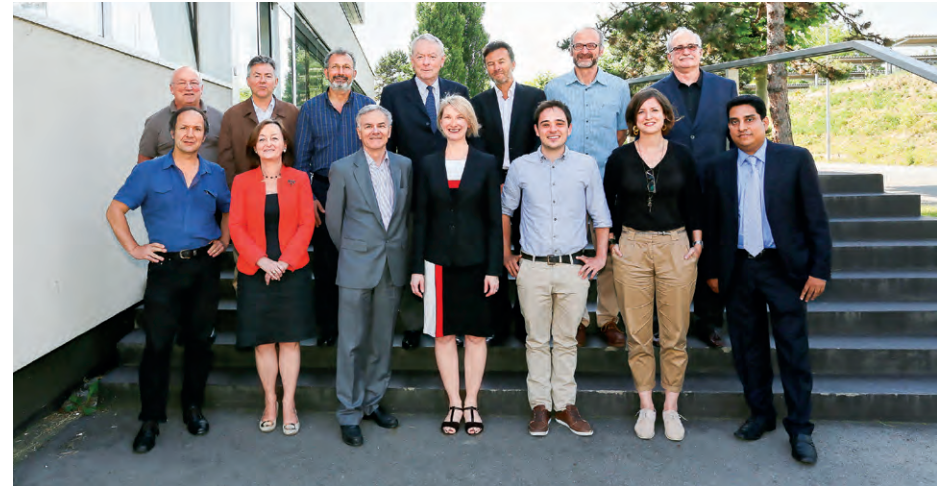
SYMPOSIUM GOUVERNANCE SPORTIVE