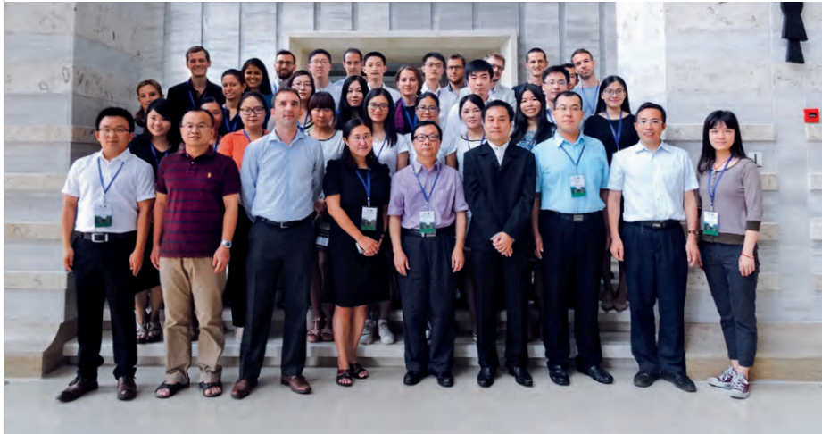
5TH SWISS ASIAN SUMMER SCHOOL